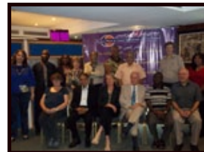
Equipo del ICSW

La reunión del Consejo de supervisión y asesoramiento del CIBS se llevó a cabo el 27 y 28 de mayo en Casablanca, Marruecos. Dicha reunión convocó a todos los Presidentes Regionales junto a los funcionarios mundiales. El objetivo principal de la reunión de la junta fue trabajar a través de los resultados de la evaluación externa del funcionamiento del CIBS en todo lo que se refiere al programa mundial.