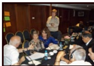
El equipo del ICSW trabajando en conjunto