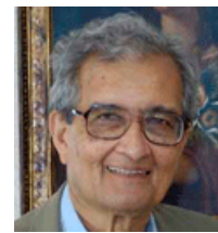
Amartya Sen (India)