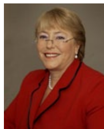
Michelle Bachelet (Chile)