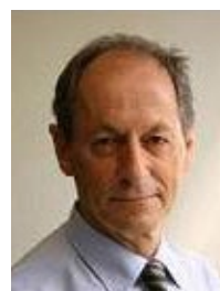
Michael Marmot (Inglaterra)