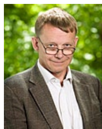
Hans Rosling (Suecia)